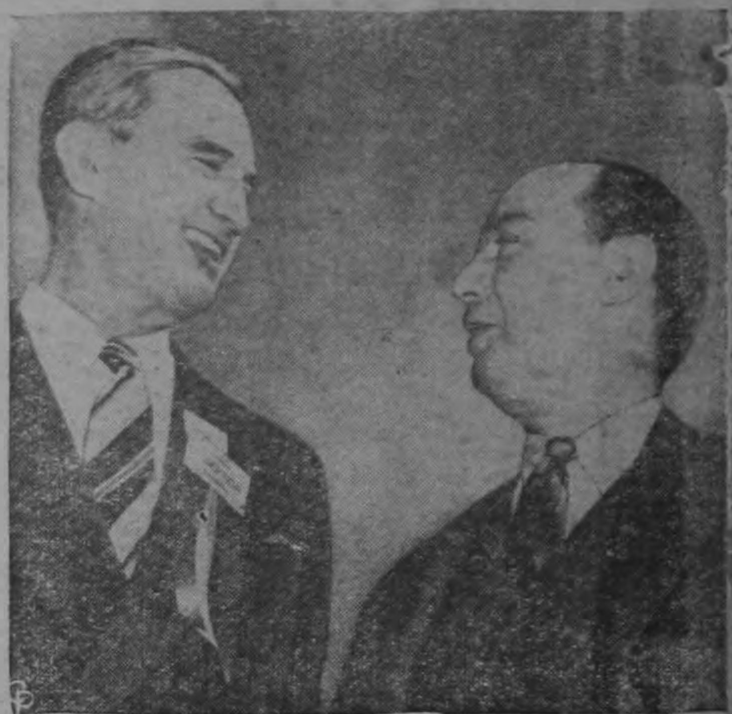
El candidato presidencial democrático, Gobernador Adlai Stevenson (derecha) charla con Stuart Symington, después de llegar a Kansas City, Missouri, para pronunciar un discurso de la campaña electoral. En su discurso, Stevenson hizo referencia a Symington, candidato democrático a Senador por Missouri, como "mi muchacho". El gobernador de Illinois elogió al Presidente Truman y atacó a Ike como "el candidato honorario de los republicanos para Presidente".