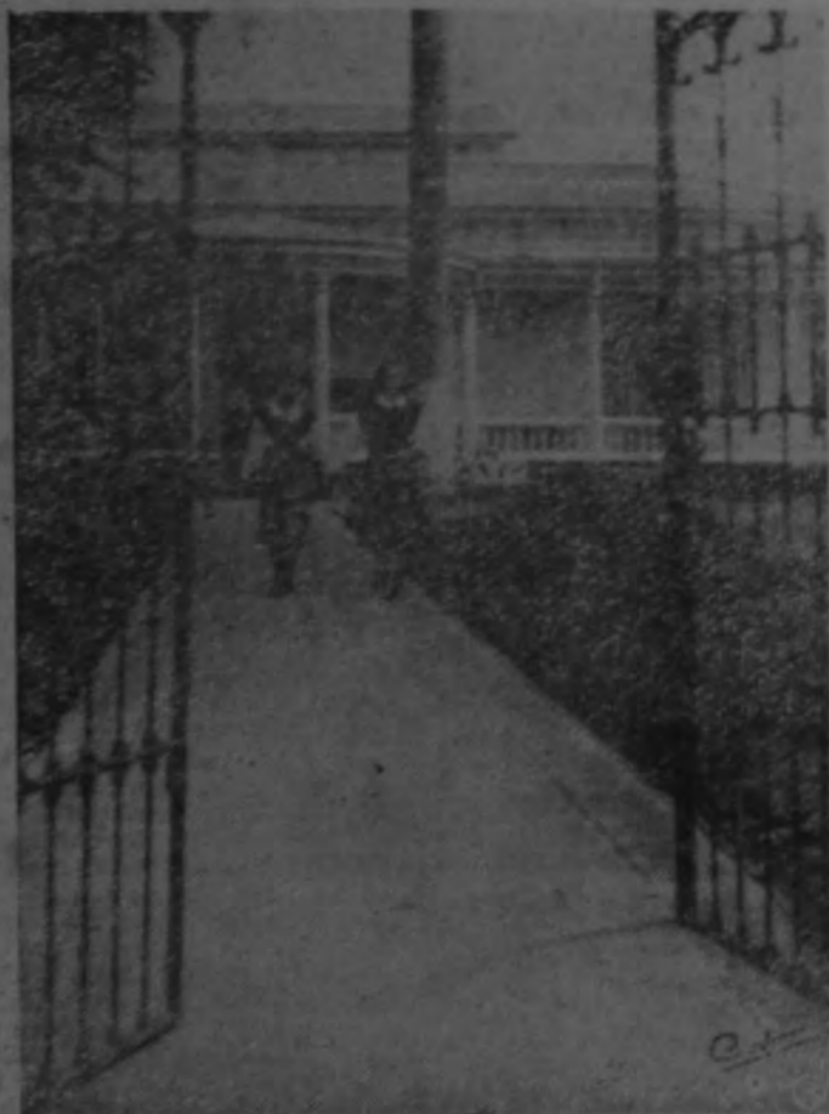
Con asistencia del señor Presidente de la República, don Otilio Ulate, se realizó ayer la inauguración oficial del Liceo de Señoritas "Anastasio Alfaro", que fuera creado por decreto de 20 de Setiembre del presente año, para rendir homenaje a ese eminente educador y hombre de ciencia. En artística y simbólica foto ofrecemos una vista de la entrada del nuevo instituto; y un aspecto de la ceremonia inaugural.