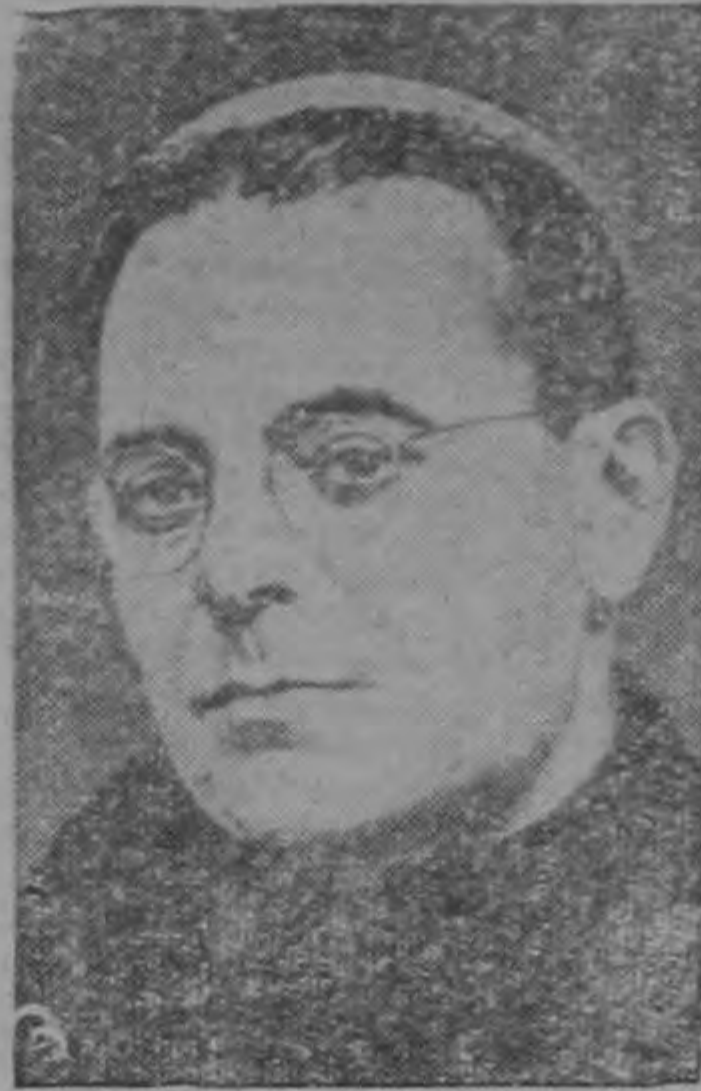
Monseñor Eugenio Bossilkov, -condenado a muerte por un tribunal comunista en Bulgaria. El Monseñor fué declarado culpable de "conspiración contra el Estado", una acusación siempre propicia de los rojos.